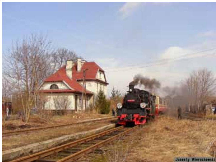
Kolejka wąskotorowa; fot. Jacenty Wierchowski

Jacenty Wierchowski Sekcja Drezynowa Piaseczyńskiej Kolei Wąskotorowej ■