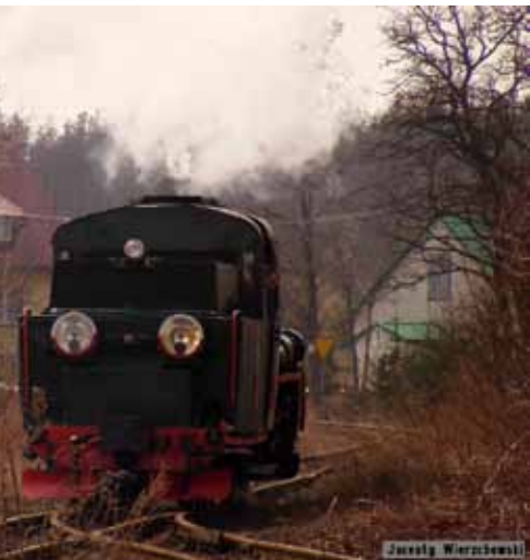
Kolejka wąskotorowa

Trasa kolei do Grójca liczy 14 przystanków, w sumie 28 km, które pociąg pokonuje w godzinę. Na pierwszym z nich, Wiadukcie, dosiada się Pani Iwona. Mieszka w Zalesiu Górnym od roku, wiele słyszała o kolejce i postanowiła w końcu odbyć podróż w wąskim klimacie. Obok samego przystanku w kierunku Warszawy