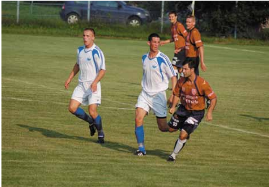
Mecz piłki nożnej; fot. Cezary Łączyński

połowy padł pierwszy celny strzał, który od razu zamienił się na gola. Dośrodkowanie Klepczyńskiego z rzutu różnego wykorzystał Wiktor Lach, który głową trafił na 1-0.